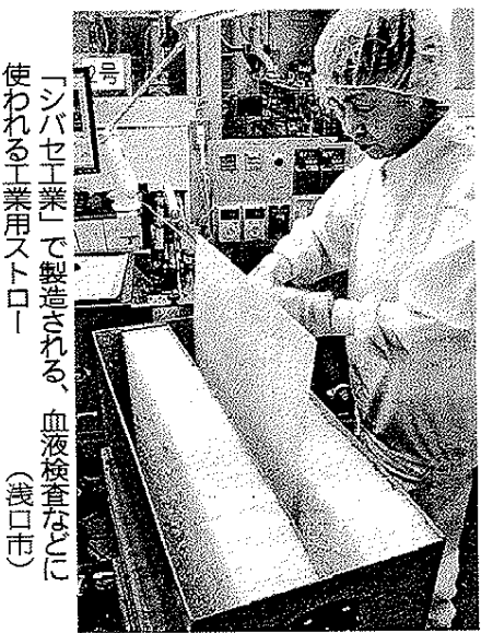
「シバセ工業」で製造される、血液検査などに使われる工業用ストロー (浅口市)

1926年創業の「シバセ工業」は、工業用ストローの製造を2001年に始めた。最も需要があるのが医療機器用で、血液検査のスボイト、ア